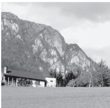
Der Weissenstein bei Solothurn. Der Solothurner Stein stammt aus dem nahegelegenen Jura und wurde in und um Solothurn nachweislich bereits seit der Römerzeit abgebaut.

S olothurn ist eine steinreiche Stadt. Dieser iGuide wird Sie zu einer Reihe von Sehenswürdigkeiten führen – zu «Steindenkmälern» – die demonstrieren, dass diese Bezeichnung tatsächlich zutrifft. In der sehenswerten Altstadt der Kantonshauptstadt gibt es kein Bauwerk, das nicht aus Stein wäre. Freilich sind die meisten Häuser verputzt. Aber mehrere wichtige Gebäude wurden so sorgfältig errichtet, dass die Fassaden nicht verputzt werden mussten.