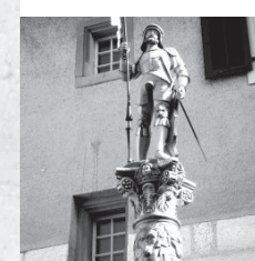
Mauritius Brunnen. Das Original der Brunnensäule befindet sich im Steinmuseum.