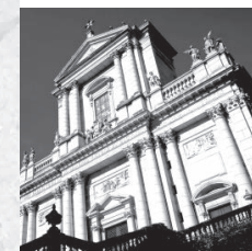
Die den Stadtheiligen Urs und Victor geweihte frühklassizistische St. Ursen Kathedrale wurde von 1762 bis 1773 erbaut.

N achfolgend sehen Sie einige der «Steindenkmäler», die im Zuge dieser iGuide -Stadtführung besucht und erläutert werden.