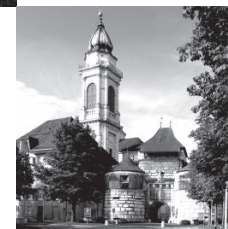
Das von zwei Rundtürmen flankierte Baseltor mit dem Turm von St. Ursen.